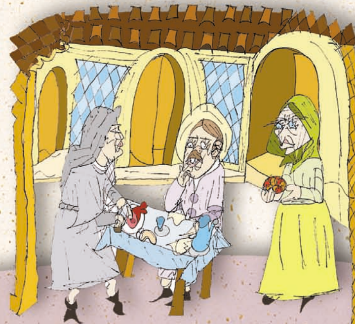
Rielaborazione di un'opera di Marianna Caprioletti, artista con disabilità dei Laboratori della Comunità di Sant'Egidio